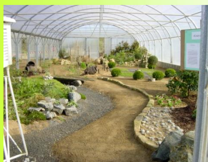
Réalisation effectuée par les apprentis

Objectif général : Gérer un chantier de création ou d'entretien / Participer à l'étude de projets.