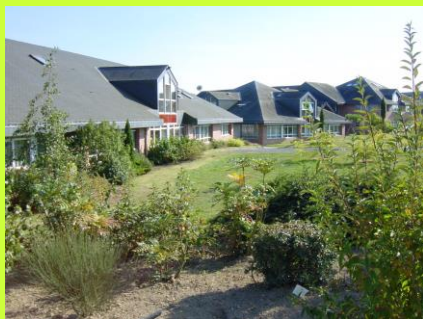
Nantes Terre Atlantique